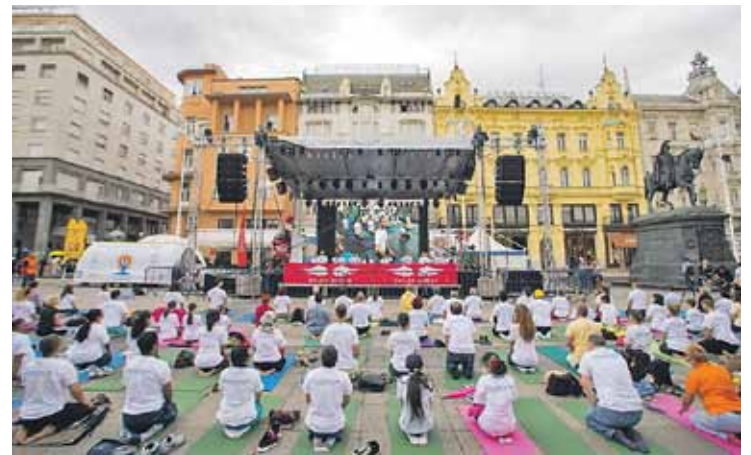
Međunarodni dan joge na Trgu bana Jelačića