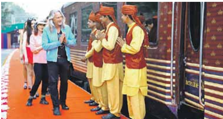
Maharaja Express vlak: otkrivanje indijskog nasljeđa

ljude. U proteklih godinu dana, 'ACG-Lukaps' najavio je planove proširenja u vrijednosti od 35 milijuna eura u Ludbregu; Globalni IT div Infosys otvorio je uslužno-istraživački ured u Karlovcu koji